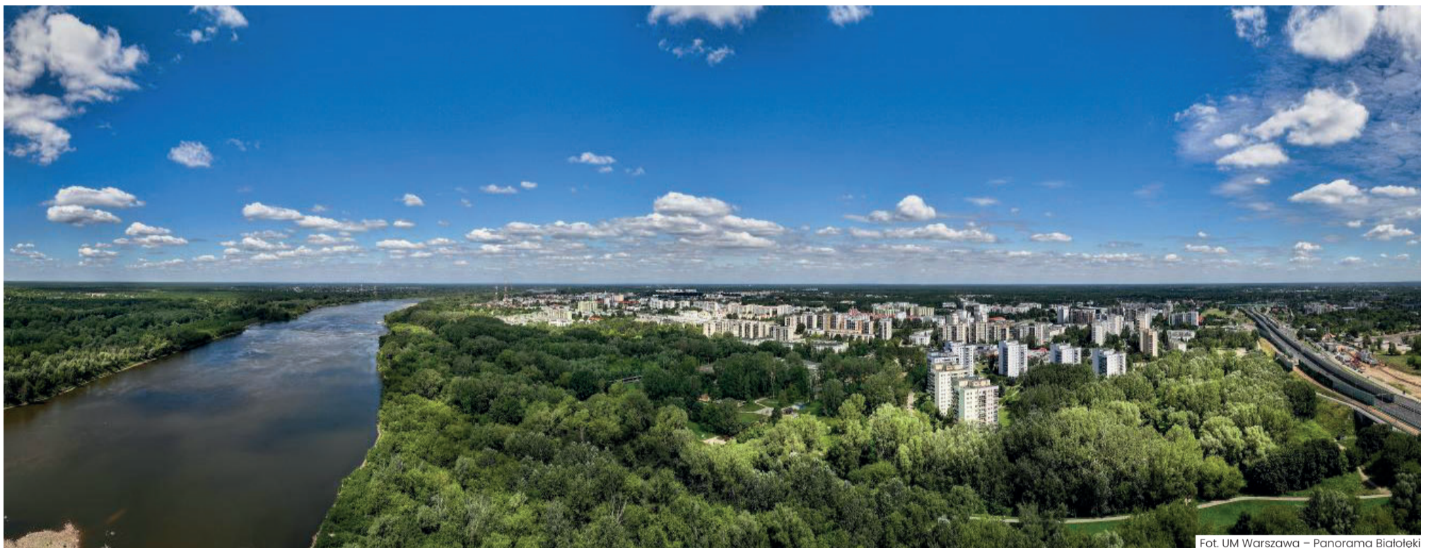
Panorama Białołęki

Dziś ten obszar pozostaje w większości niezagospodarowany, a jego naturalny charakter sprawia, że znajduje się w granicach Warszawskiego Obszaru Chronionego Krajobrazu. Nowy plan nie tylko zabezpiecza tereny